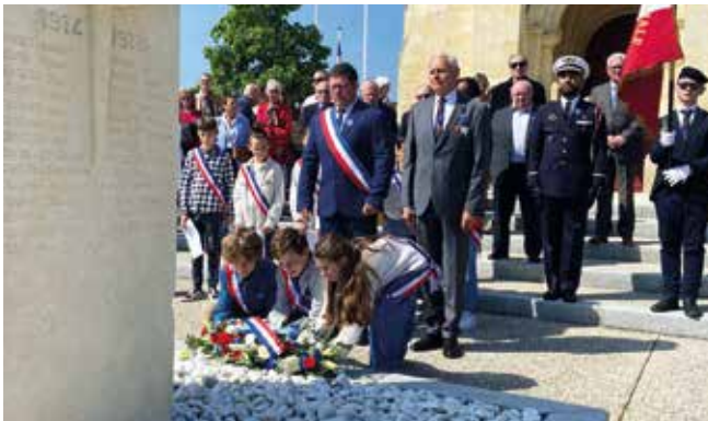
Les enfants du CMJ lors de la Commémoration du 8 mai 2024, au monument aux Morts.

Alain Caplain est le président de l'Union Nationale des Combattants à Montussan. L'association fondée au lendemain de la Première Guerre mondiale, fait vivre le devoir de mémoire des anciens combattants. Pour cela, elle œuvre auprès des jeunes populations à travers de nombreux témoignages.