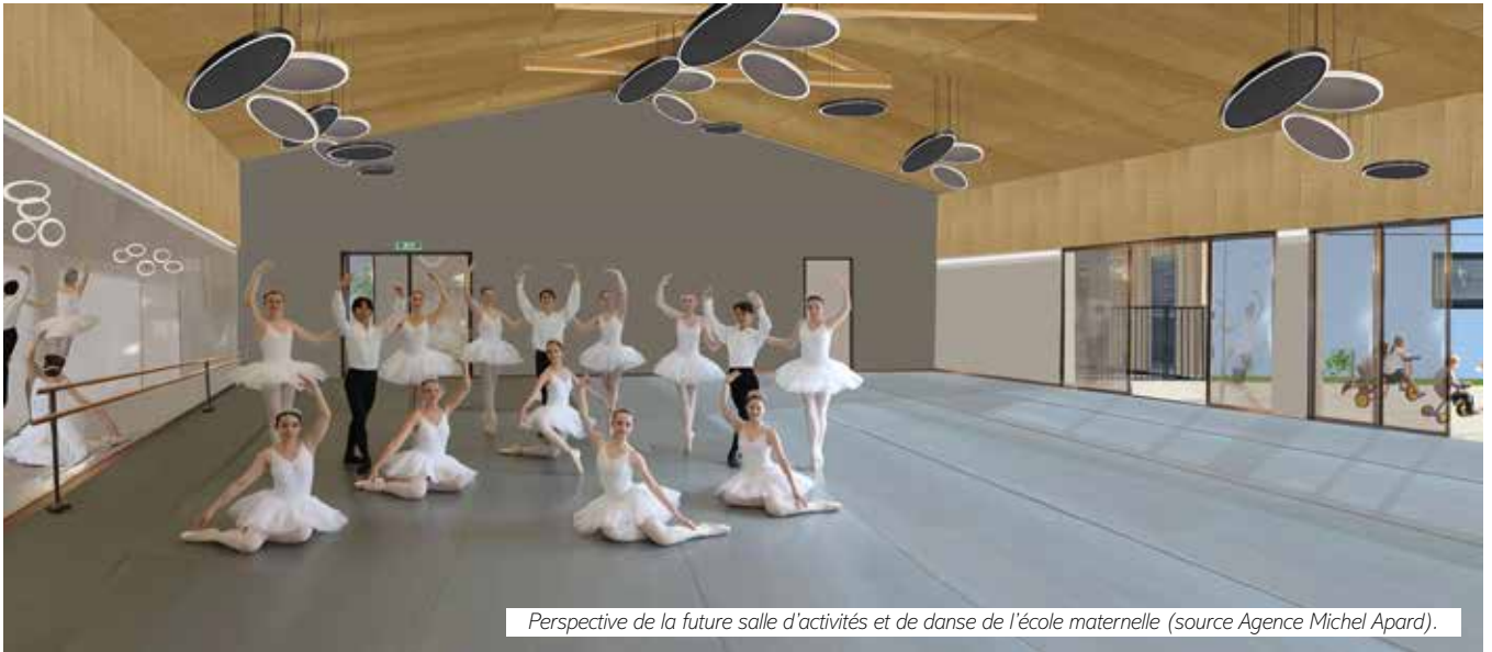
Perspective de la future salle d'activités et de danse de l'école maternelle.

L'agrandissement de l'école maternelle va permettre aux enfants de disposer d'une belle salle d'activités où ils pourront s'amuser et se développer. Plus spacieuse, cette salle va également accueillir l'école de danse de Montussan qui est devenue l'une des plus importantes du secteur.