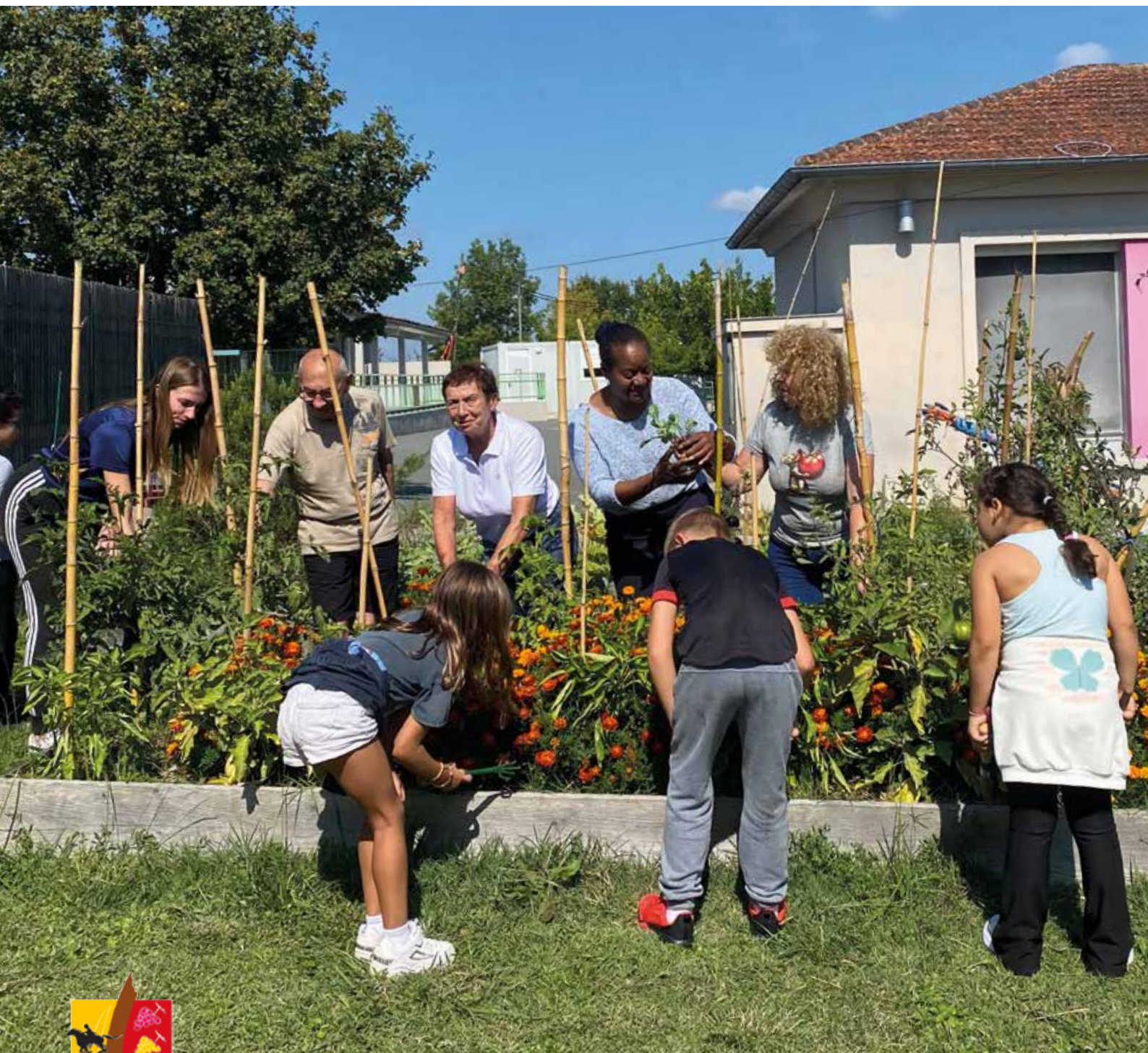
Les carrés potagers au centre de loisirs.