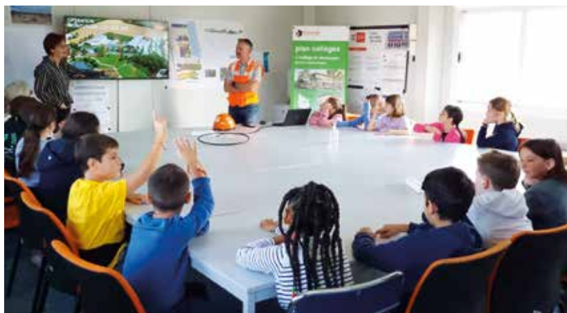
Visite du chantier par les enfants de CM2.