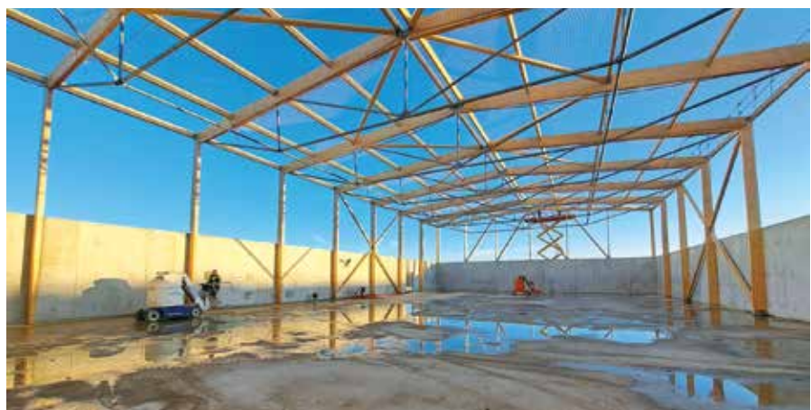
Le futur de gymnase du collège.